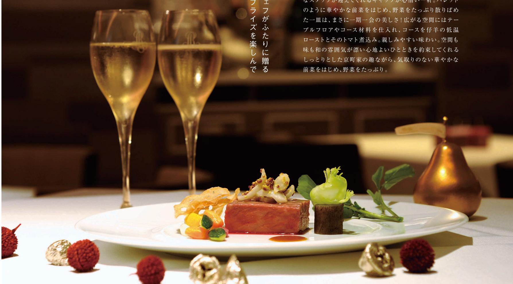
キャプション60文字 いや、じっくりと低温で火を入れた京都丹波牛のロースト。今や名物の赤ワインボン酢ソースと仏産の茸を添えて60

シャンパンを フリースタイル のシェフが ふたりに贈る 一品ごとの サプライズを 楽しんで