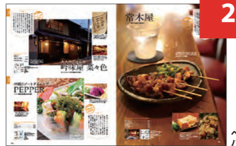
ペイドパブリシティ