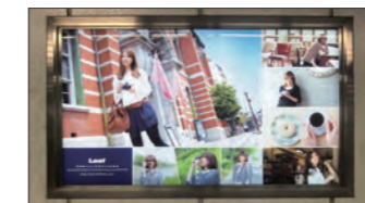
地下鉄 烏丸御池駅看板