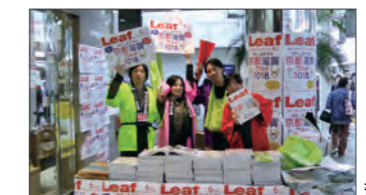
書店販売キャンペーン