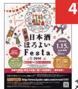
イベントメディアミックス