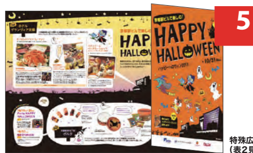
特殊広告 (表2見開き片観音)

雑誌の中で考えられる、あらゆる広告手法に対応できます(中綴じ、観音開き、片観音など)