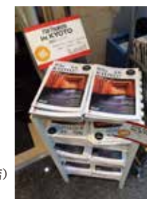
大垣書店 (烏丸三条店) 設置の様子

京都タワー 京都駅ビルインフォメーション 関西ツーリストインフォメーションセンター京都 京都駅前バスチケットセンター MK 株式会社 彌榮自動車株式会社 H.I.S (一部店舗) セブン-イレブン (京都市内一部店舗) TSUTAYA 戎橋店 大垣書店 ふたば書房 西日本書店 天神橋店 イノダコーヒ本店 京都商工会議所 京都府東京事務所 関西空港