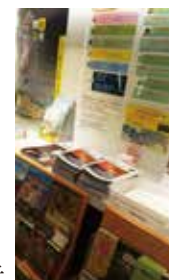
京都総合観光案内所 (京なび) 設置の様子

京都総合観光案内所（京なび） 京都国際工芸センター 京都駅イオン 京都館（東京・八重洲） 京都伝統産業ふれあい館